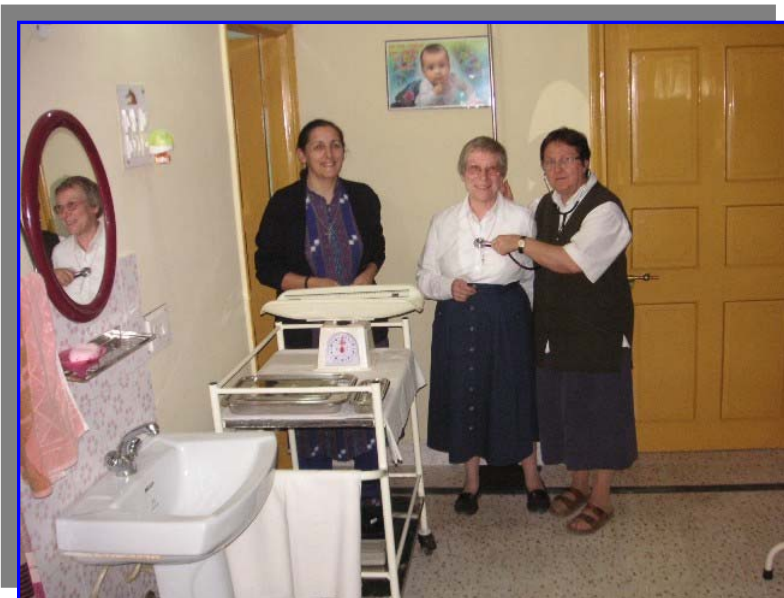
Estrenando el dispensario que han puesto en marcha las hermanas.