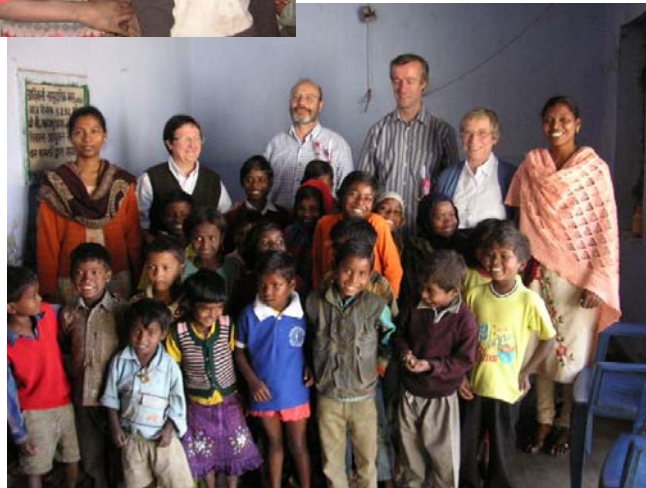
Otro grupo de niños con sus profesoras