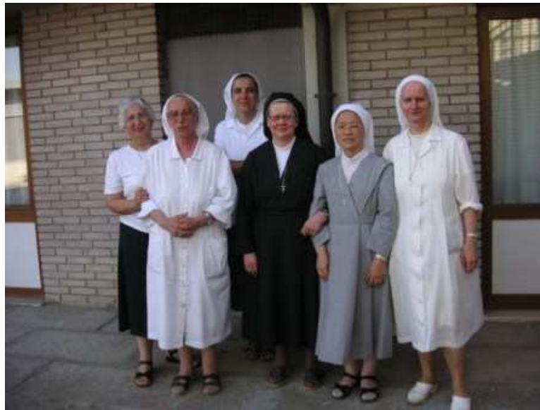
Con la comunidad