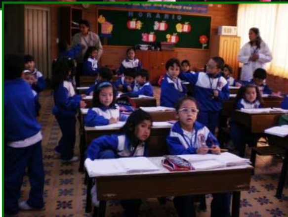
En una de las preciosas clases donde da gusto estudiar