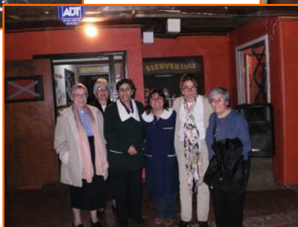
Con la directora del parvulario y una maestra